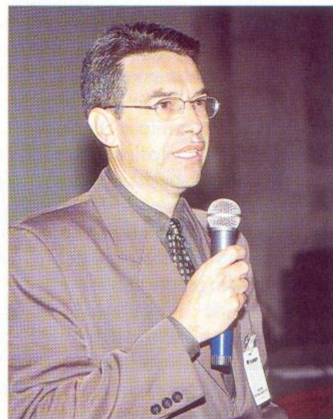
Zanotto: do laboratório à produção

Diretrizes - Fecha-se assim o ciclo que a FAPESP está montando: de um lado, o desenvolvimento já em curso de tecnologias, viabilizado por meio dos auxílios a pesquisas em anda-